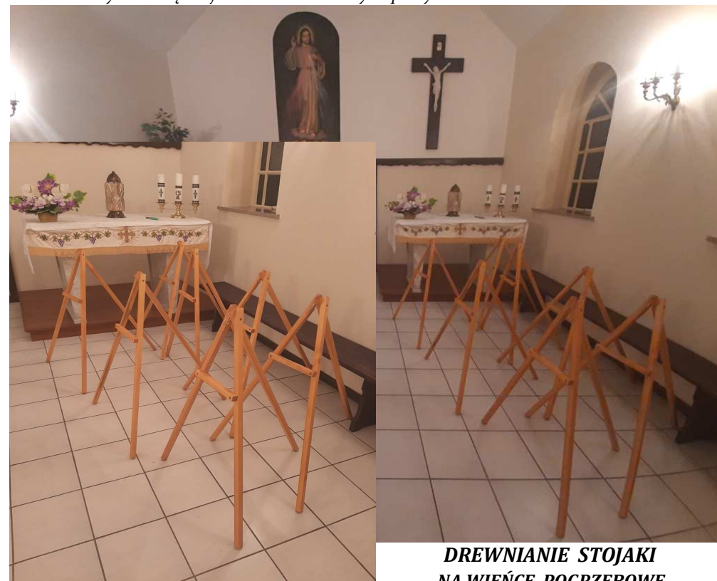
DREWNIANIE STOJAKI NA WIEŃCE POGRZEBOWE