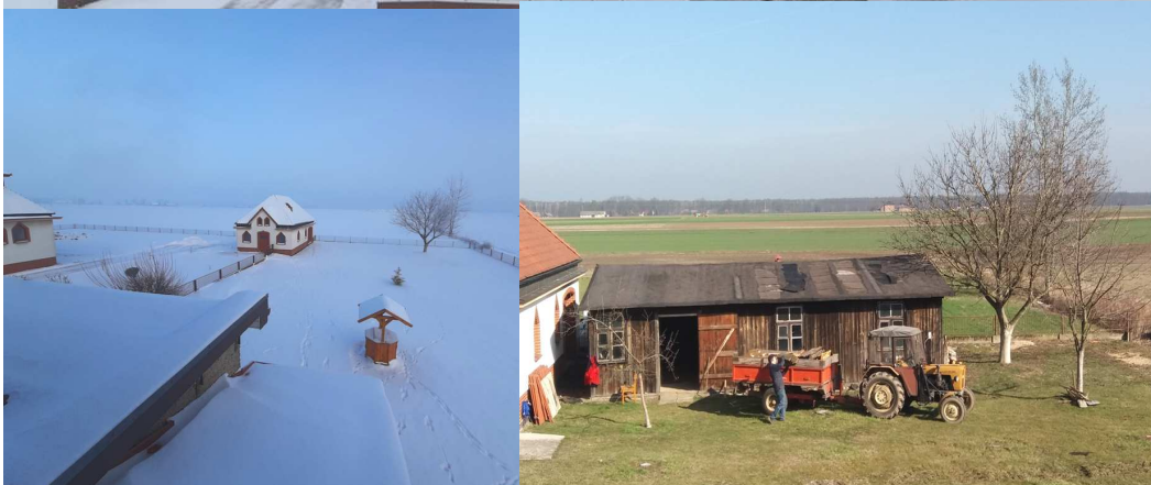
Farski ogród – styczeń 2021 r.