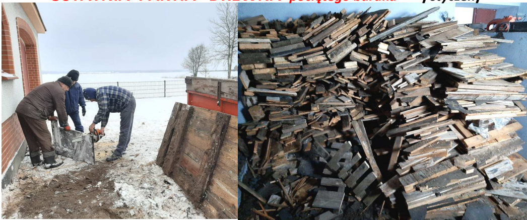
KRAJOBRAZ ZIMOWY /styczeń/