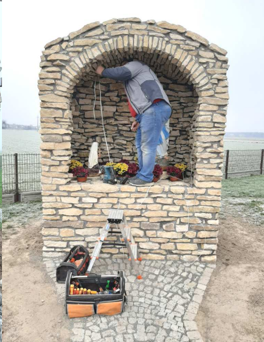
podświetlenie groty LED /grudzień/ będzie jeszcze tabliczka pamiątkowa