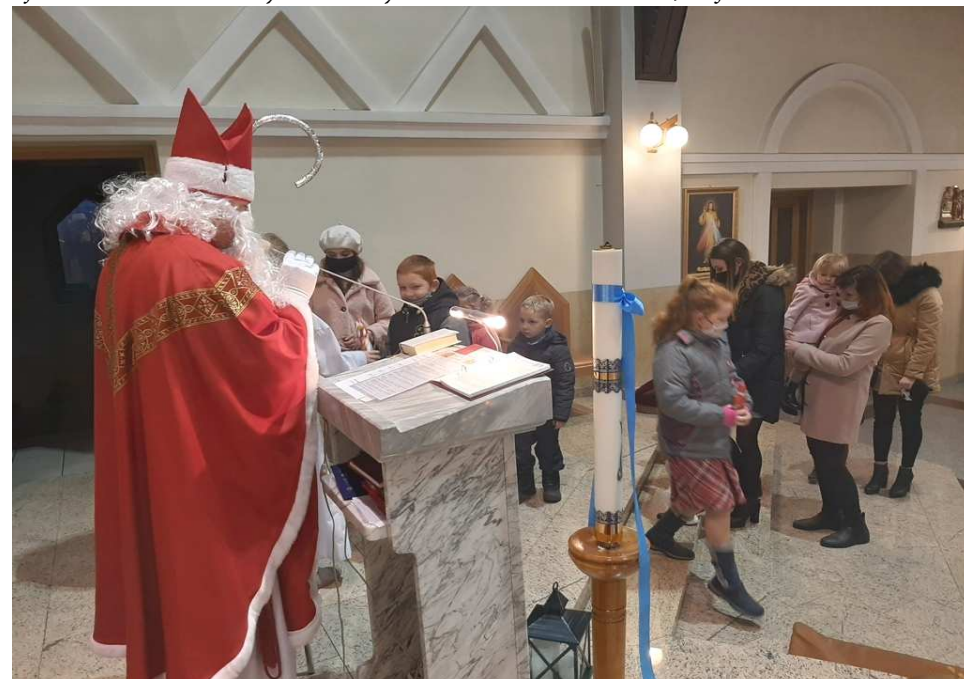
ODWIEDZINY ŚW. MIKOŁAJA W PARAFII – 6 grudnia br.