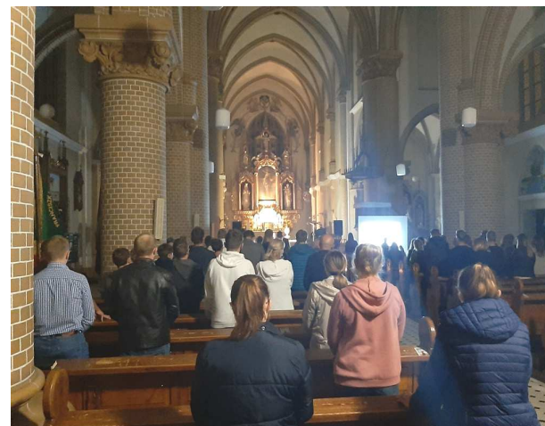
Czuwanie młodzieżowe w Borkach Wielkich