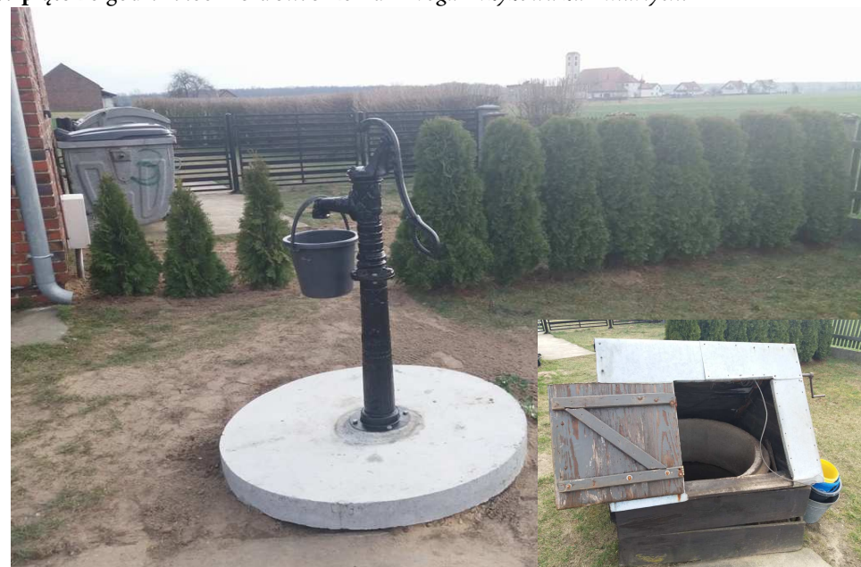
Nowa pompa do wody ze studni na cmentarzu