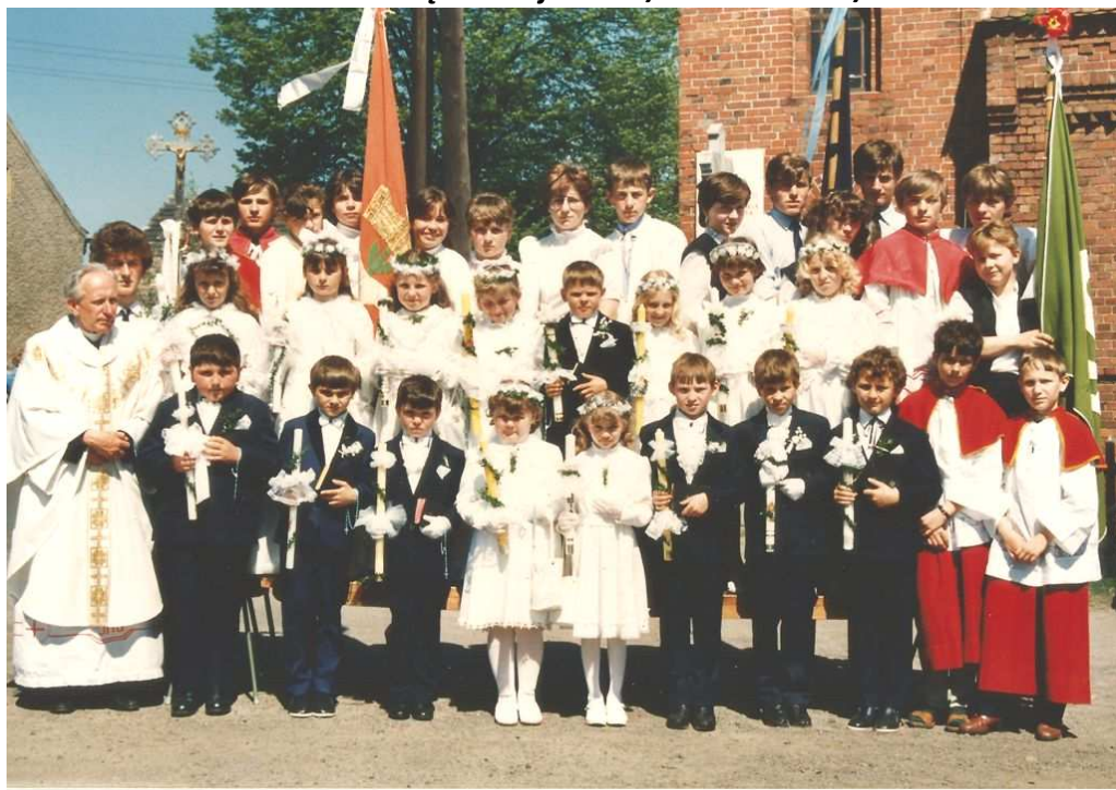
I Komunia Święta – maj 1986 r. /ks. A. Muszalik/