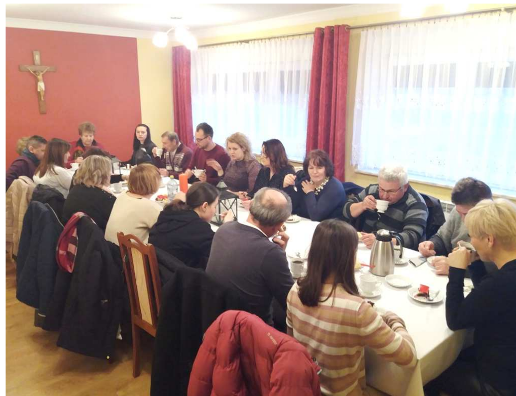
Poczęstunek na plebanii dla chórzystów z Krapkowic