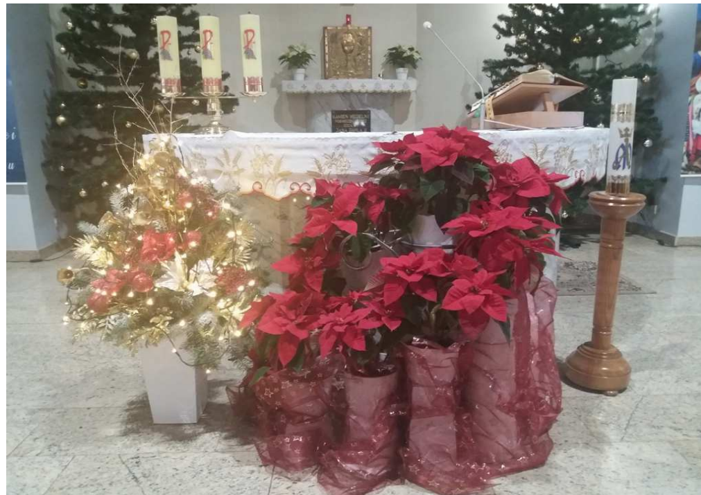
Wystroj świąteczny przed ołtarzem /grudzień-styczeń/