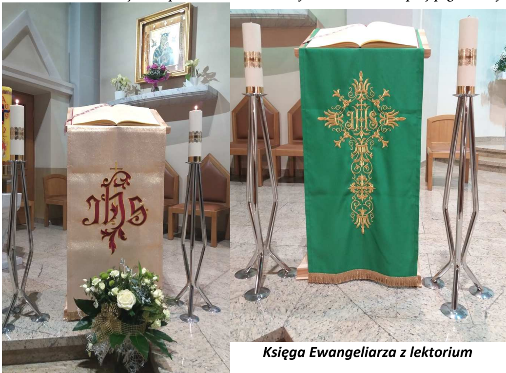
Księga Ewangeliarza z lektorium