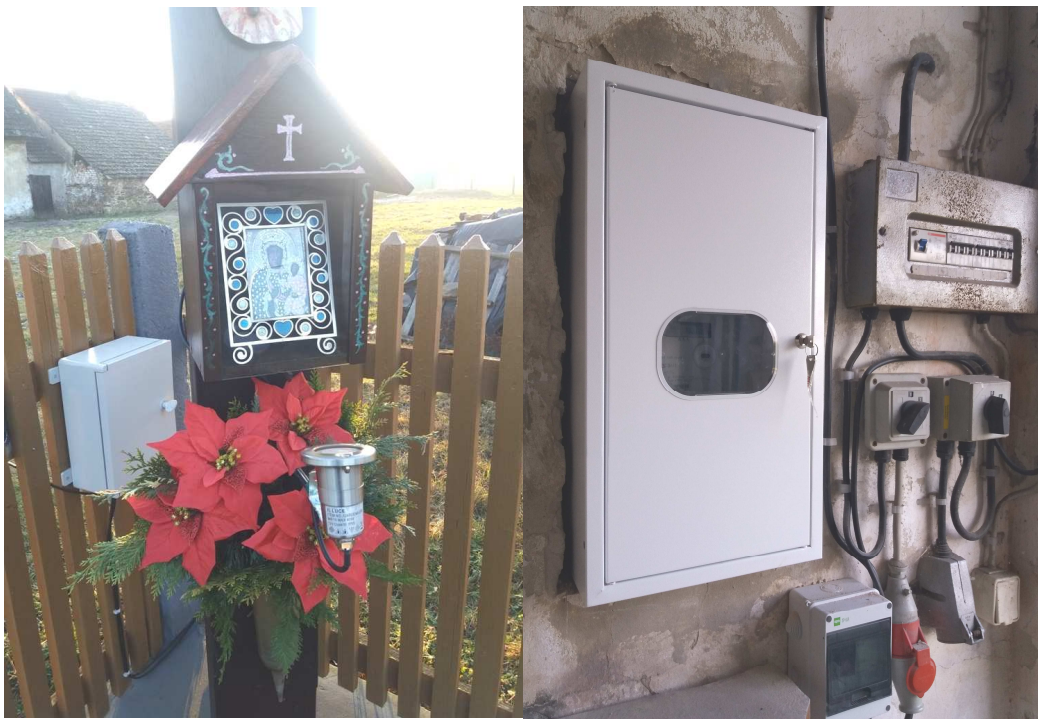
Podświetlenie krzyża i kapliczki MB