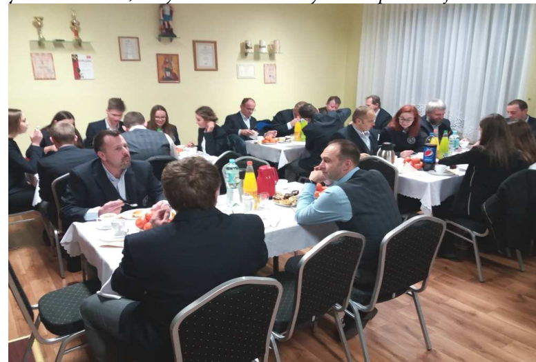
Poczęstunek w Klubie dla orkiestry z Opola-Szczepanowic /12 stycznia/