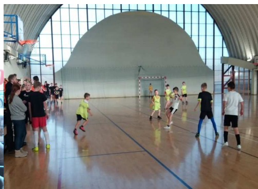
Ministranci w akcji!!!