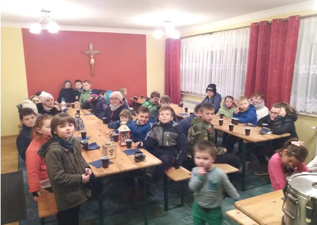
Rogaliki świętomarcińskie i herbata dla dzieci i młodzieży na plebanii