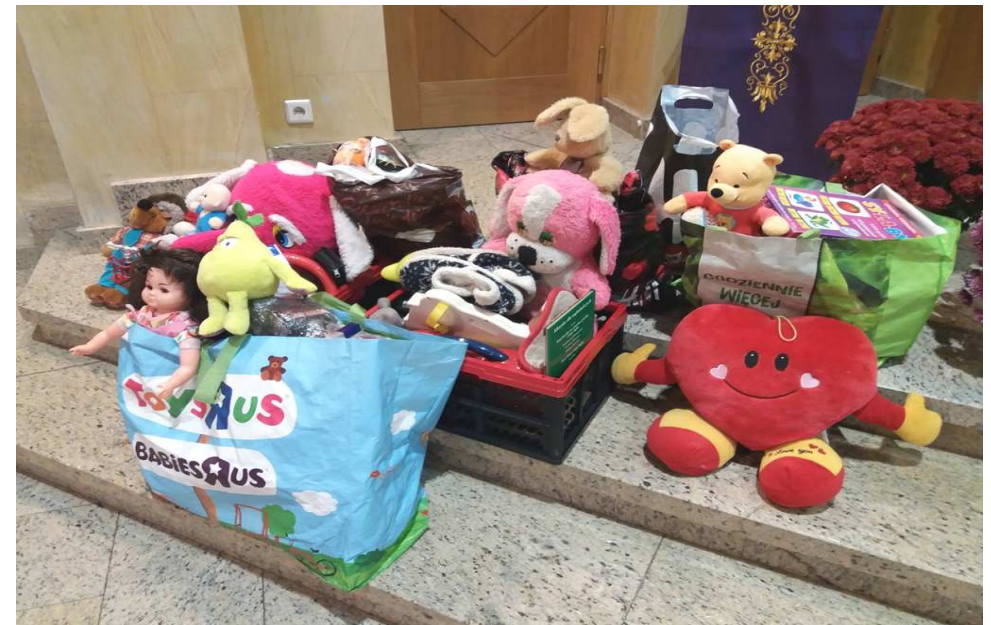
Zabawki, maskotki i gry planszowe dla dzieci z Domu Dziecka /Dzień Ubogich/