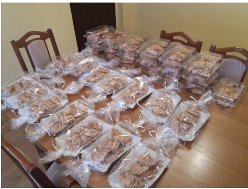
Rogaliki świętomarcińskie /10 listopada/