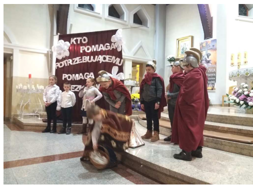
Spektakl o Św. Marcinie /15 listopada/