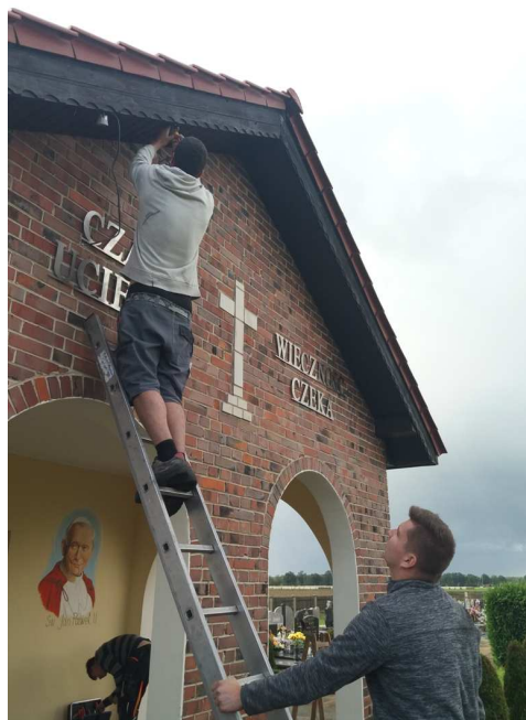
Montaż podświetlenia napisu w kaplicy