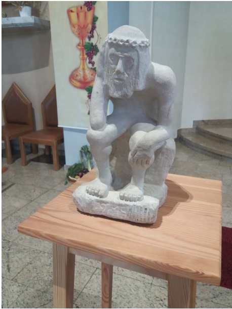
Figurka Pana Jezusa frasośliwego wykonana z piaskowca