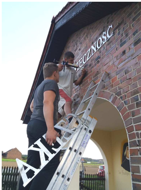
Montaż napisu w kaplicy przedpogrzebowej