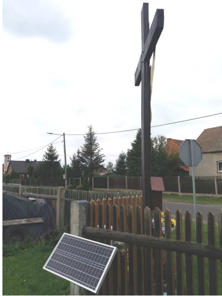
Podświetlenie krzyża k. P. Szulca