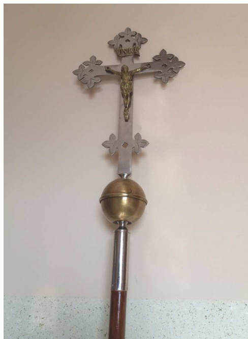
Krzyż po renowacji