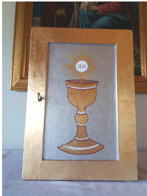
Tabernakulum po renowacji