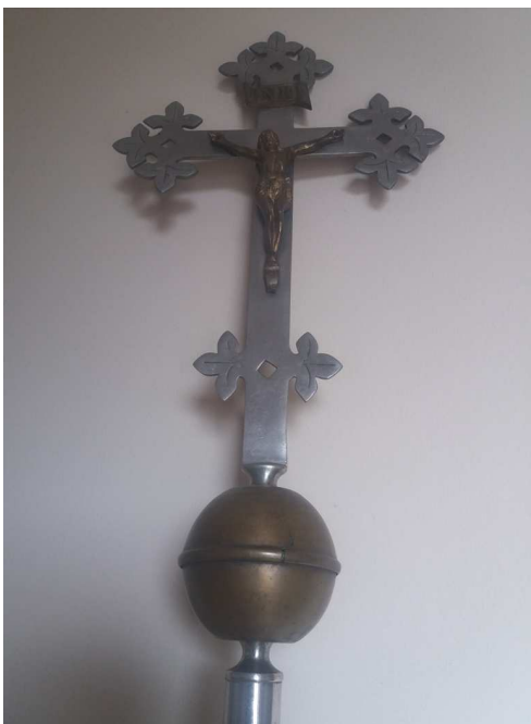
Krzyż przed renowacją