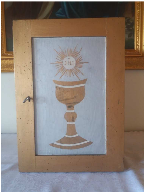
Tabernakulum przed renowacją