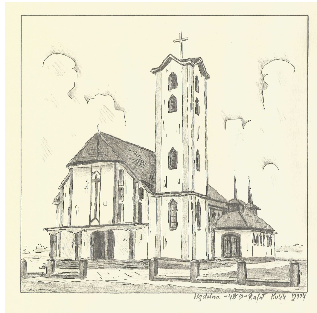
Grafika kościoła wykonana ołówkiem /2004 r./

GAZETKA PARAFII ŚWIĘTOGO URBANA W WĘDZINIE Nr 38/380 XXIV NIEDZIELA ZWYKŁA 15.09.2019