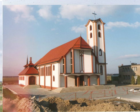
WIĘCEJ ZDJĘĆ na www.parfiawedzina.pl