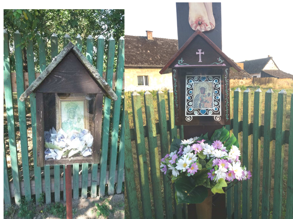
Dawna kapliczka MB