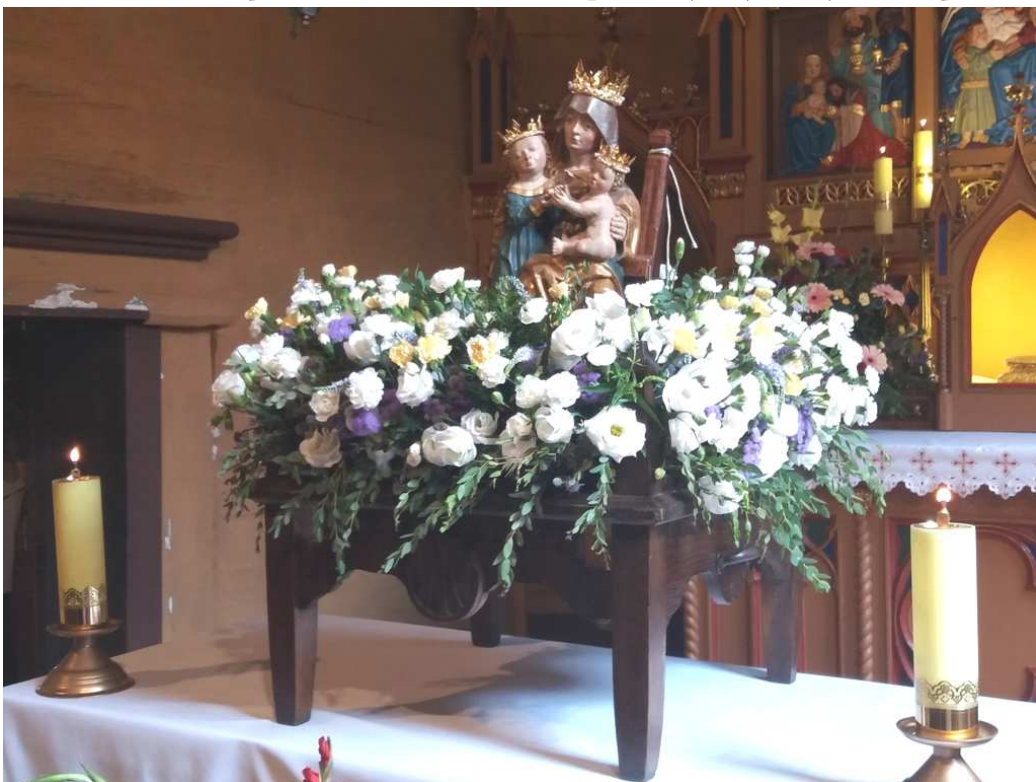
Zdjęcia z tej uroczystości na parafialnej stronie internetowej www.parafiawedzina.pl