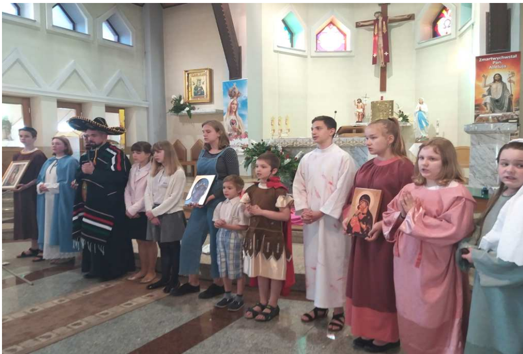
WYSTRÓJ KOŚCIOŁA PARAFIALNEGO