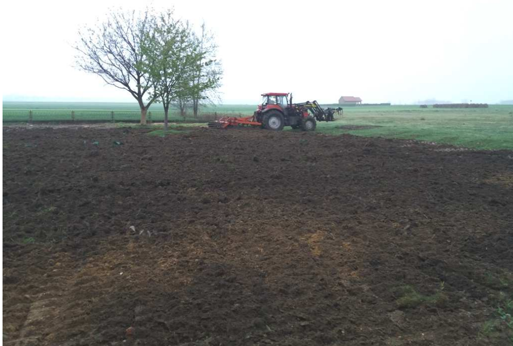
Prace porządkowe w ogrodzie