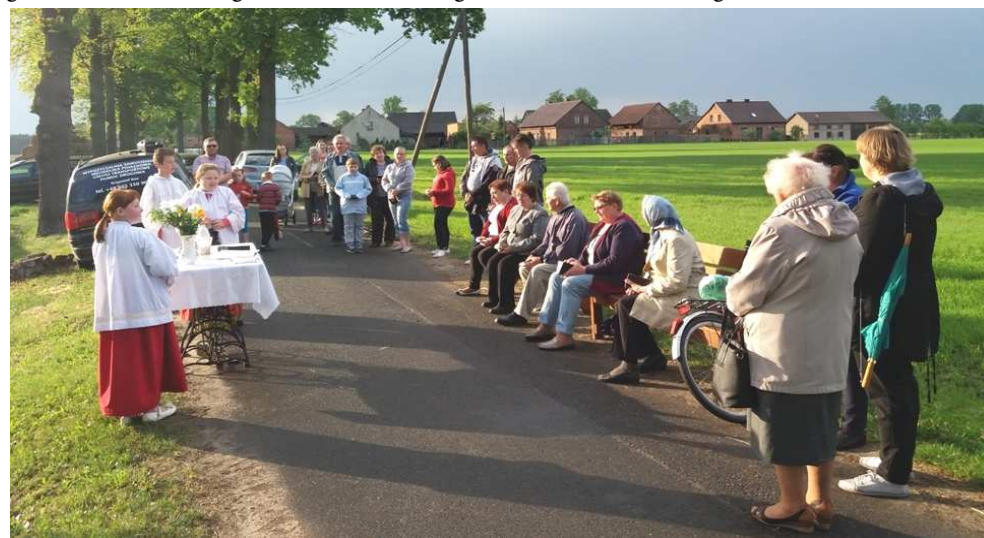
Nabożeństwo Majowe na Marcach /maj 2018 r./