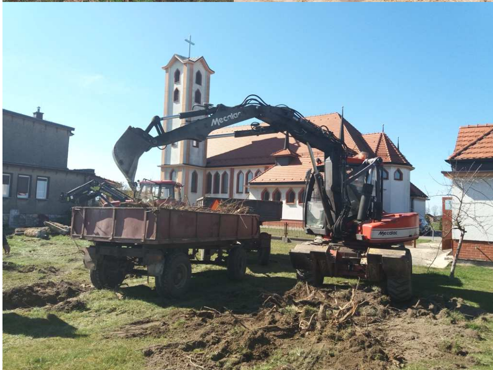
Prace porządkowe w ogrodzie plebanijnym /przed montażem nowego płotu/