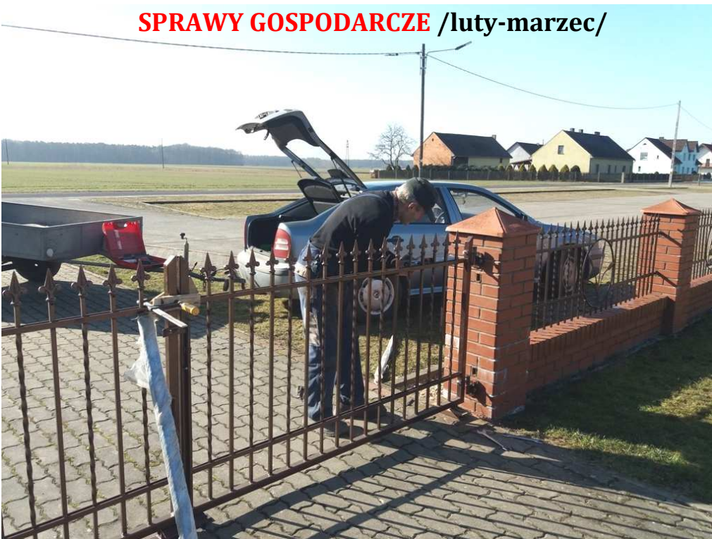
Montaż bramy wjazdowej i furtki od strony „FARY”