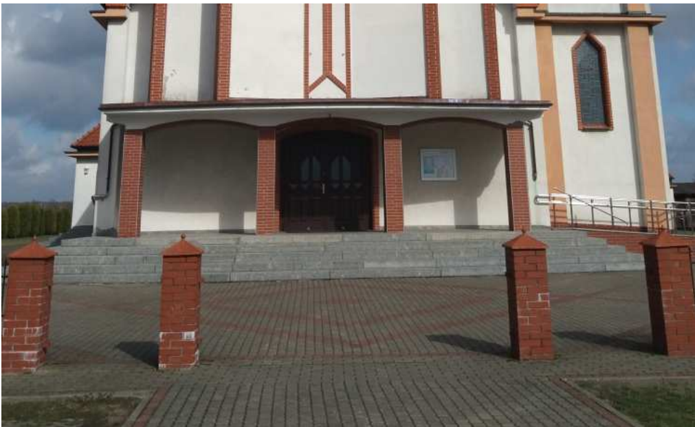
Co dalej z OGRODZENIEM wokół KOŚCIOŁA i PLEBANII???