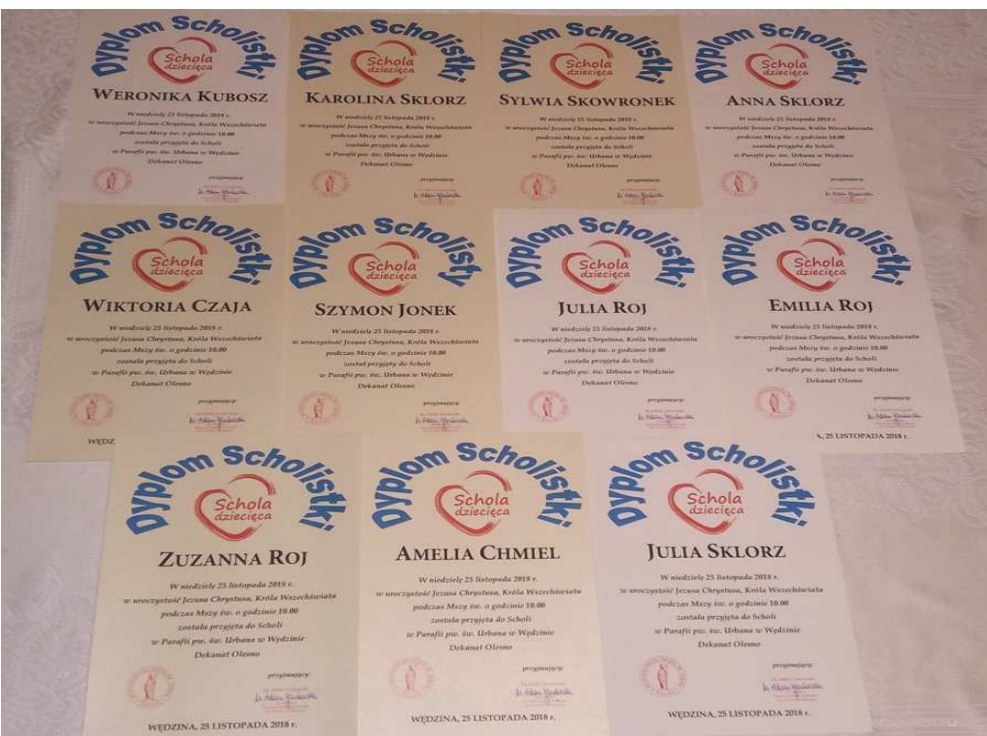
Przyjęcie do SCHOLI DZIECIĘCEJ – niedziela 25 listopada 2018 r.

łą”. Dla uczniów Jezusa nie będzie to dzień lęku, ale ufności. Aby przyjąć postawę ufności w dniu ostatecznym wymaga do przygotowania i przemiany naszego życia. Dlatego w Adwencie musimy wcielić w życie zalecenie samego Jezusa: „Uważajcie na siebie, aby wasze serca nie były ociążałe [...] Czuwajcie więc i módlcie się w każdym czasie, abyście mogli uniknąć tego wszystkiego, co ma nastąpić, i stanąć przed Synem Człowieczym”. Przyjście Boga do nas jest wielkim wydarzeniem. Dlatego samo oczekiwanie na Pana zakłada naszą gotowość na spotkanie z Nim. Temu ma służyć nasza czujność i prośba słowami Psalmisty: „Daj mi poznać, Twoje drogi, Panie, naucz mnie chodzić Twoimi ścieżkami”. Wszystko po to, żebyśmy stawali się „coraz doskonalszymi” na przyjście Pana. Na co według wskazówek Jezusa musimy zwrócić uwagę? Chodzi o czujność i rozwój modlitwy, abyśmy wskutek nieumiarkowania nie ulegli ociążałości serca, swoistej znieczulicy na sprawy Boże, a zatrzymali się jedynie na troskach doczesnych.