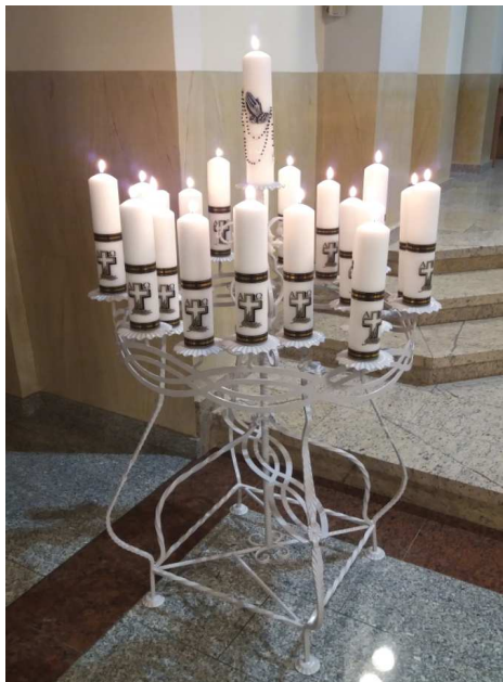
Świecznik od 8 Róż Różańcowych