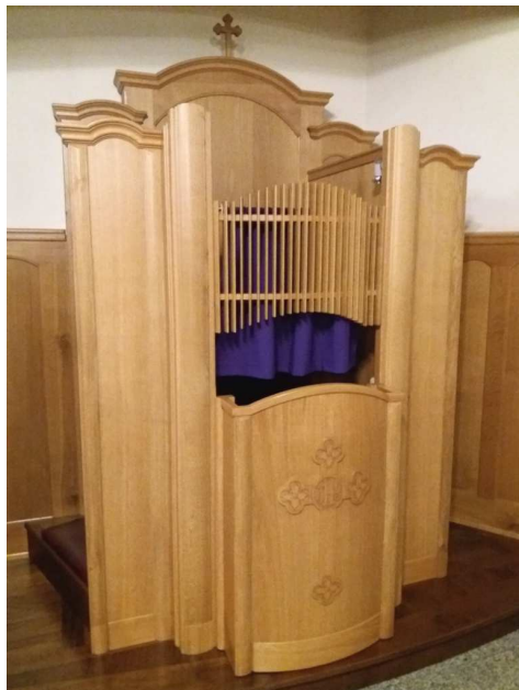
Fioletowe zastawki w konfesjonatach