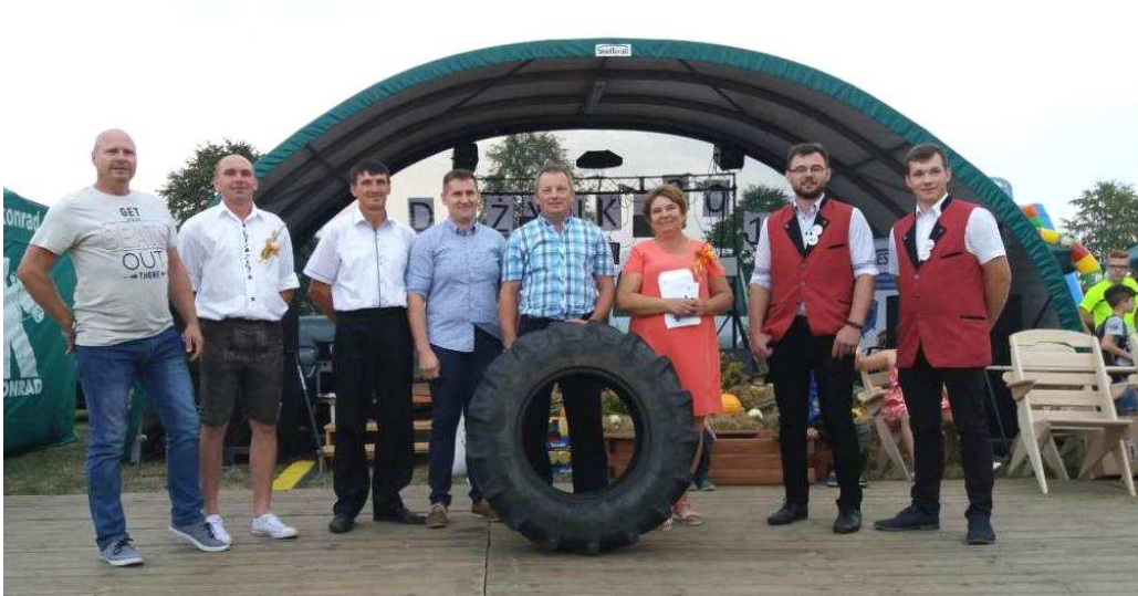
Konkurs – Najsilniejszy Rolnik 2018