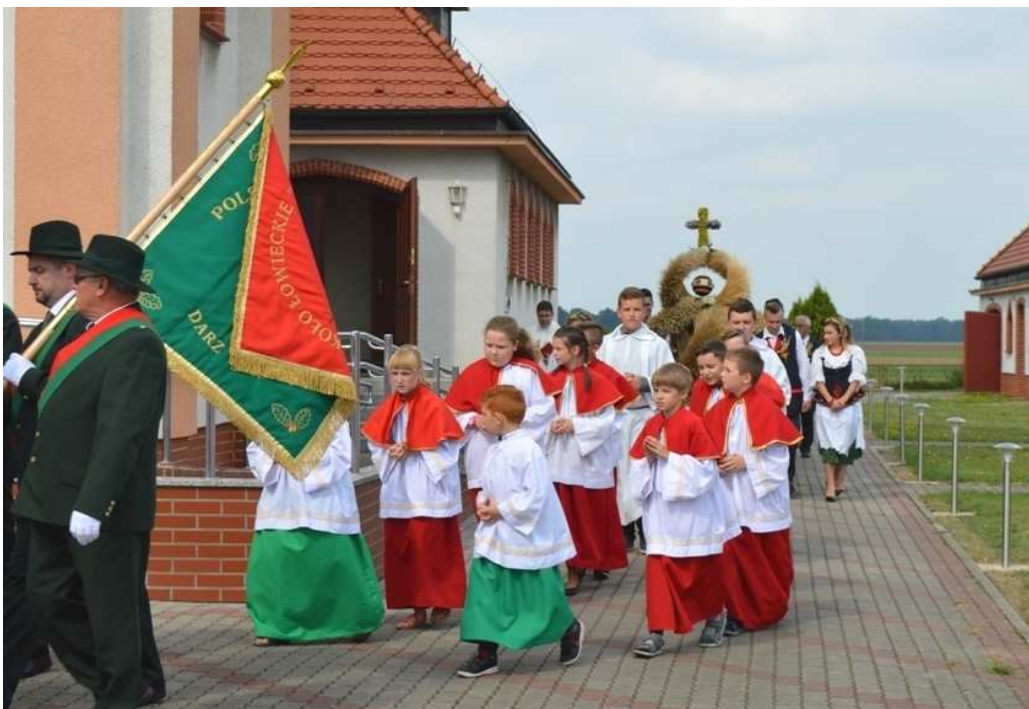
Procesja do kościoła z koroną dożynkową