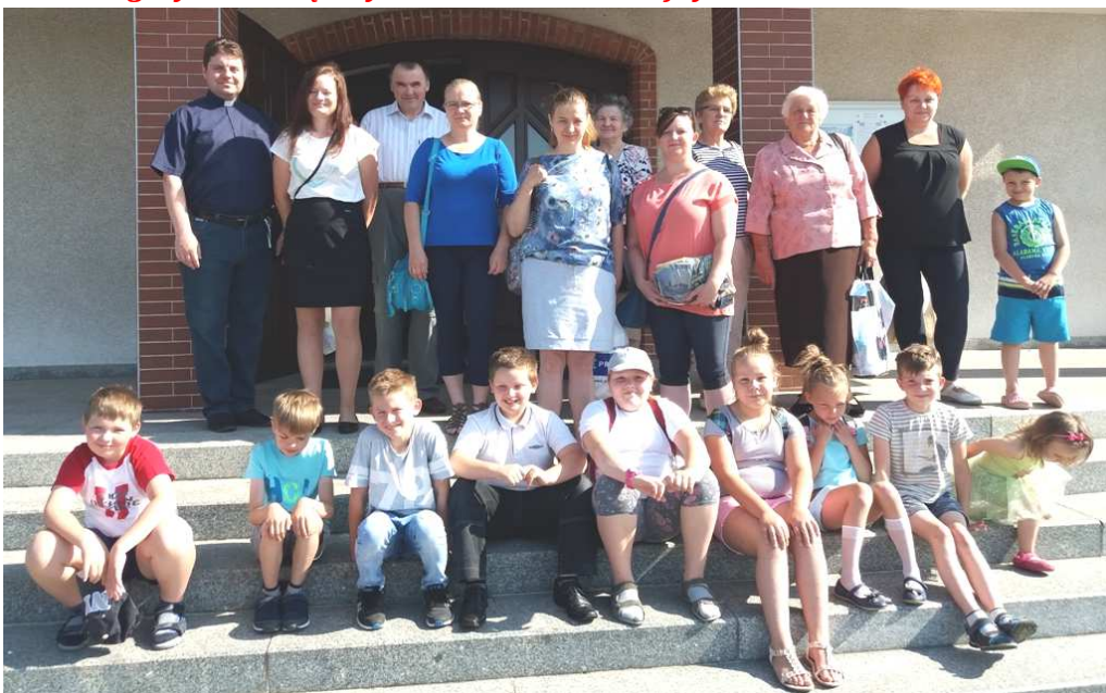
Grupa dzieci i opiekunów z Wędziny i Sierakowa Śląskiego

Pielgrzymka dziękczynna dzieci I-komunijnych – 16 czerwca 2018 r.