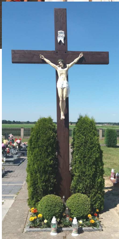
Krzyż na cmentarzu