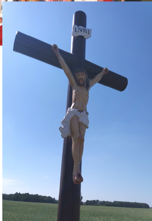
Krzyż na Gruckach